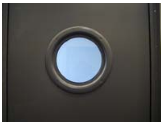
VISOR ACUSTICO (OJO DE BUEY) 300 mm Ø