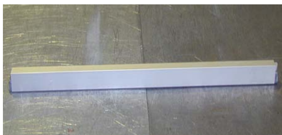
BURLETE AUTOMATICO DE SUELO