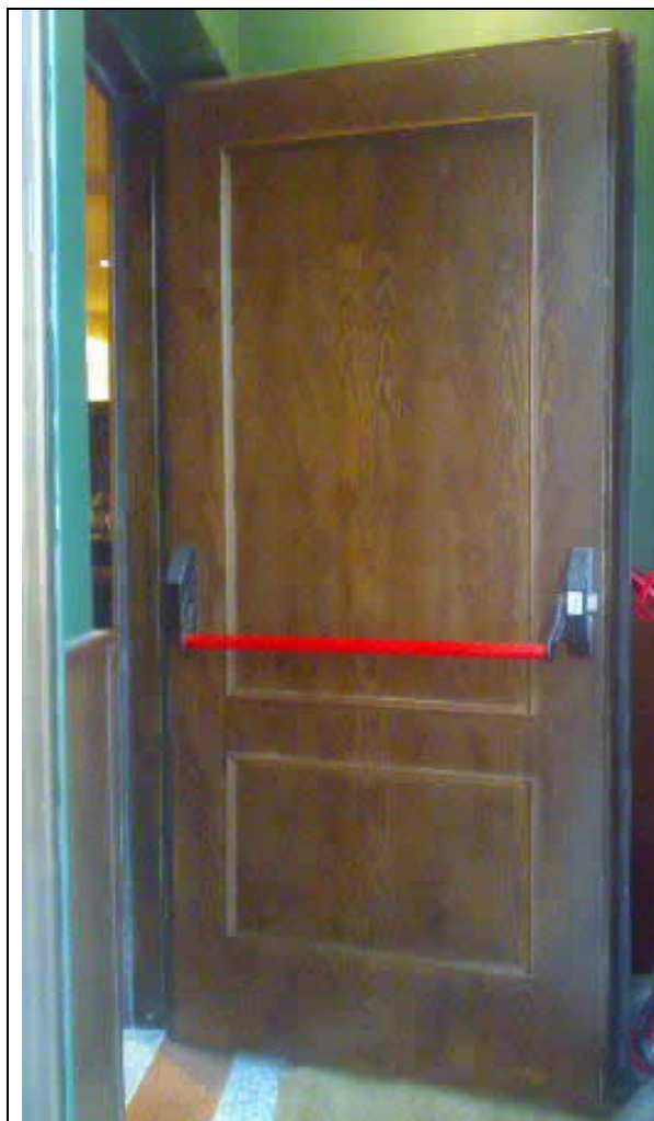
TERMINACION CHAPEADA EN MADERA