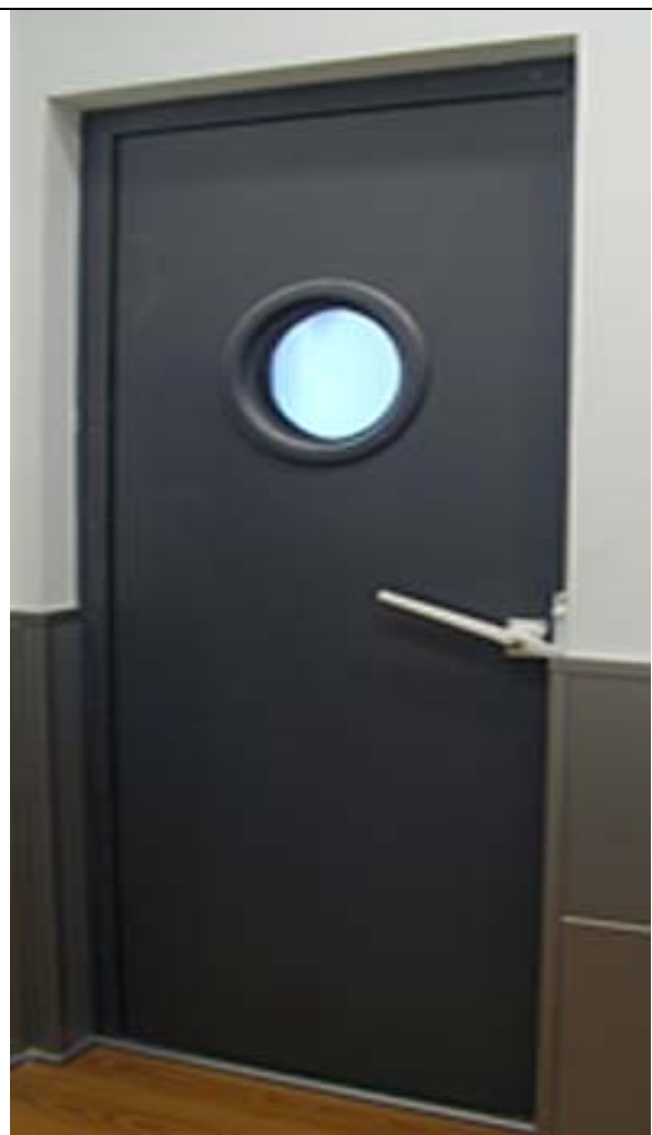
TERMINACION EN CHAPA