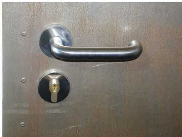
MANILLA DE RODAMIENTOS Y CERRADURA