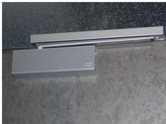
MUELLE DE CIERRE